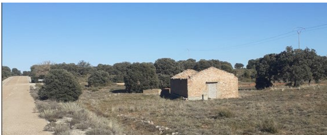
Aljibe de Don Pedro o de Cinco Navajos

Desde este punto la Cañada continúa paralela a la carretera por su margen izquierda, alternándose tramos de tierra con tramos del antiguo trazado de esta última que aún conservan el asfalto. Habiendo recorrido aproximadamente 1,6 kilómetros por terreno llano, en el paraje denominado “Pan y tortas” se atraviesa una vaguada que también va a desembocar al arroyo “Berbián”.