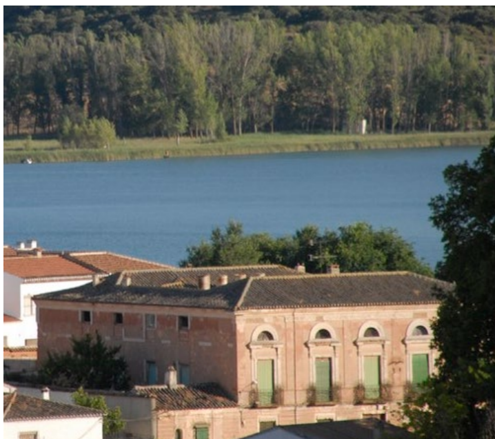
Casa del Rey